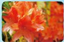
レンゲツツジ 勢至平