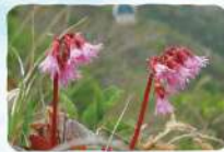
イワカガミ 薬師岳～安達太良山