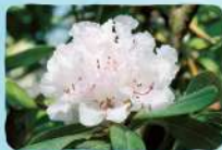
ハクサンシャクナゲ 奥岳～薬師岳・勢至平