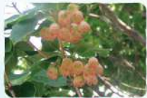
サラサドウダン 薬師岳～安達太良山・ 勢至平