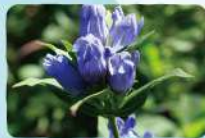
リンドウ 薬師岳・勢至平