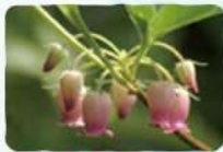
ウラジロヨウラク 薬師岳～安達太良山・ 勢至平