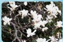
コブシ 奥岳～薬師岳