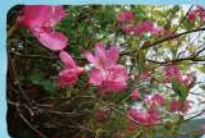
ヤシオツツジ 薬師岳・勢至平・ あだたら溪谷自然遊歩道