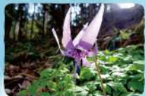
カタクリ 奥岳周辺